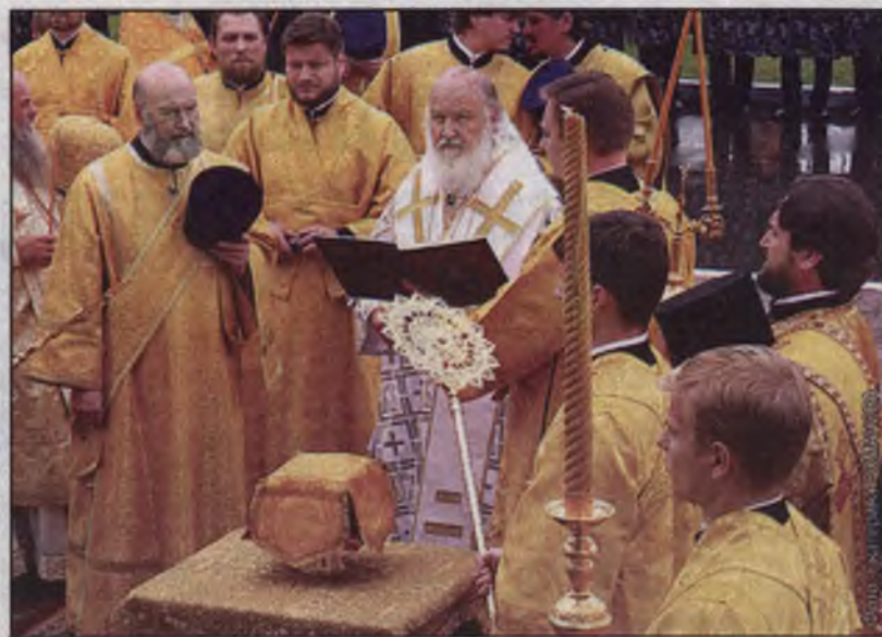
Патриарх Кирилл посетил Новокузнецк в День шахтера.

ния патриарх Кирилл встретился с вдовами и родителями погибших шахтеров. Слова, которые он им сказал, были наполнены горечью утраты и состраданием собравшимся. Патриарх го-